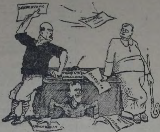
LUNA DE MIEL. — El viejo noble sin escrúpulos y la mujer de vida airada, con quien se casó por la dote, inician la vida conyugal... (La Libertad, París).

Una fuerte tormenta de piedra produjo enormes daños en las cosechas de la zona de Colico, en cuya localidad volaron los techos de varias casas.